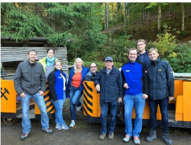
Der Vorstand der DLRG St. Peter nach der Fahrt mit der Grubenbahn

Wie sieht der Schwarzwald von unten aus? Dieser Frage ging der Vorstand der DLRG St. Peter im Rahmen seines diesjährigen Ausflugs nach. Bei bestem Oktoberwetter machten wir uns auf den Weg zum Besucherbergwerk "Finstergrund" nach Wieden im Südschwarzwald. Die Einfahrt in den Berg erfolgte standesgemäß per Grubenbahn. Unter Führung eines ehemaligen Wiedener Bergmanns erkundeten wir die zahlreichen Gänge unter Tage. Wir erfuhren einiges über den