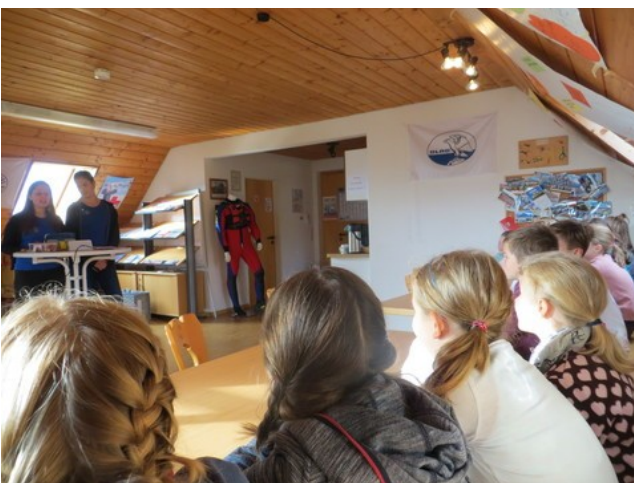
Schüler der Abt-Steyrer-Schule zu Besuch bei Feuerwehr und DLRG