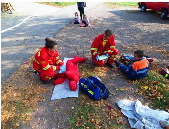
DLRG-Sanitäter versorgen die Verletzten bei der Herbstübung der FFW St. Peter

Der Auftakt bildete die monatliche Fortbildung der einzelnen Teileinheiten der DLRG-Wasserrettung Breisgau. Diese fand am Abend des 19. Oktober statt. Dieses Mal war die DLRG St. Peter mit der Ausrichtung dieses Fortbildungsabends an der Reihe. Den Schwerpunkt bildet eine Sanitätsübung rund um das Haus der