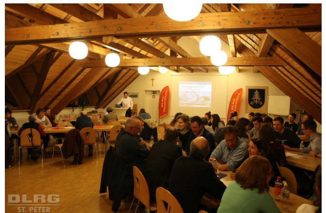
Volles Haus: Mitgliederversammlung der DLRG St. Peter